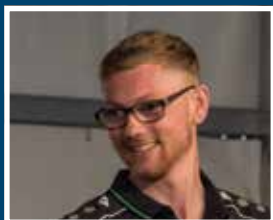
Aus der Sicht des Präsidenten