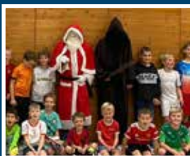
E- / F- & G-Junioren